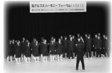
中学生の混声合唱