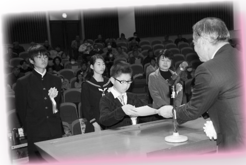
川柳・標語入賞者の表彰