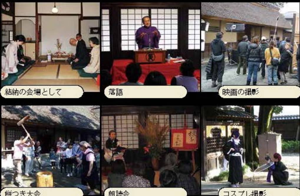
結婚の会場として 落語 映画の撮影