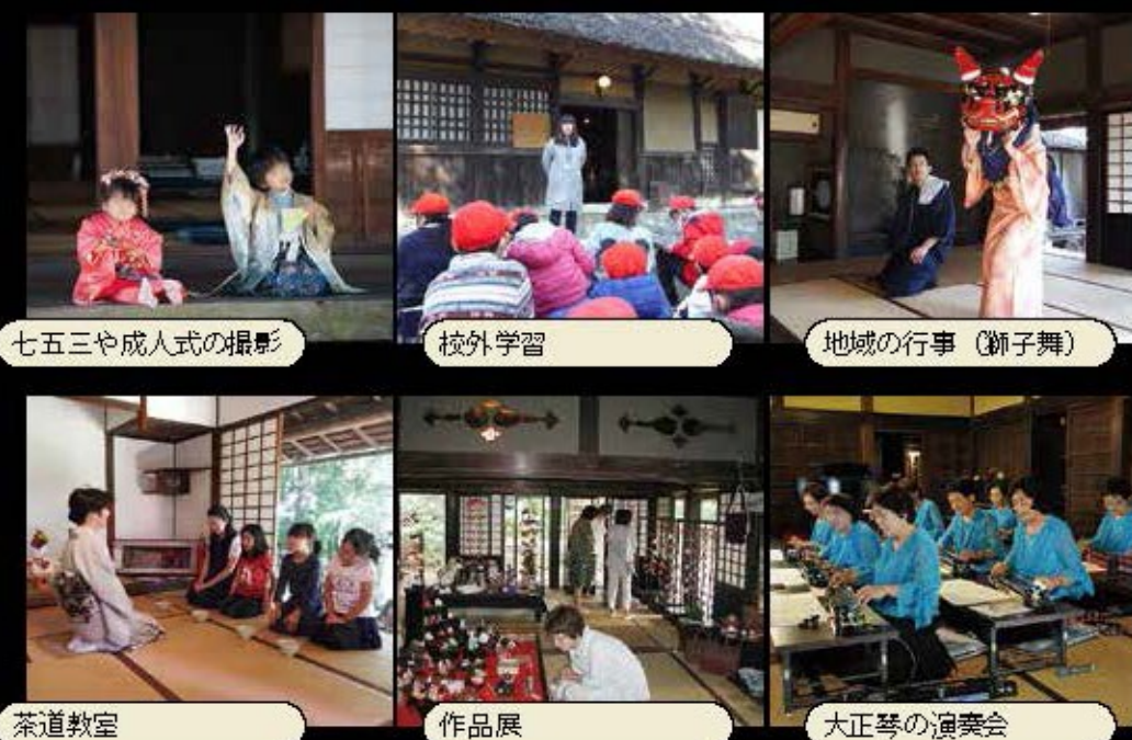
七五三や成人式の撮影 校外学習 地域の行事(獅子舞) 茶道教室 作品展 大正琴の演奏会