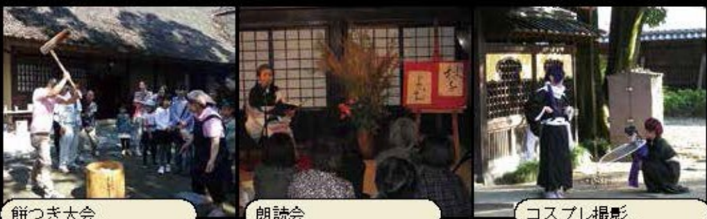
餅つき大会 朗読会 コスプレ撮影