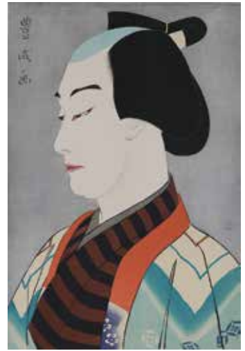
山村耕花 《梨園の華 初世中村鴈治郎の茜半七》

新型コロナウイルスの感染状況により、臨時休館する場合がありますのでご了承ください。 開館情報につきましては当館ホームページでもご覧いただけます。 ご来館の際にはマスクの着用や入口での手指消毒等、感染防止へのご協力をお願いします。