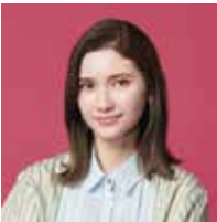
市川 紗椰 (モデル)

2021年 2月7日(日) 開場/午後2時 開演/午後3時 終演予定/午後5時30分(休憩含) 桃源文化会館 桃源ホール ※要入場整理券 ※未就学児の同伴・入場はお断りいたします。