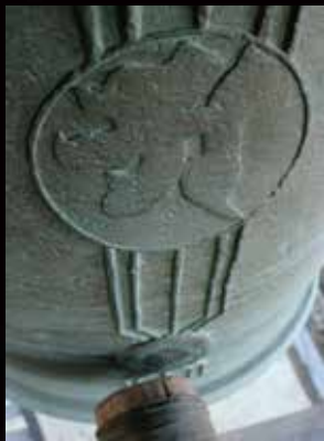
胎蔵界大日如来を表す梵字

市内に残る最も古い梵鐘は加賀美山法善護国寺の銅鐘(註4)です。年号などの銘はありませんが、特徴から中世の作と考えられています。中央には胎蔵界大日如来を表す梵字が施されています。縦帯に梵字を持つ梵鐘は全国で三口しか残されており、特別な梵鐘であることがわかります。五百年以上も加賀美を守ってきたこの鐘は、今は9月の虚空蔵菩薩の祭典と大晦日に見参拝者によって撞かれて、その音を響かせます。