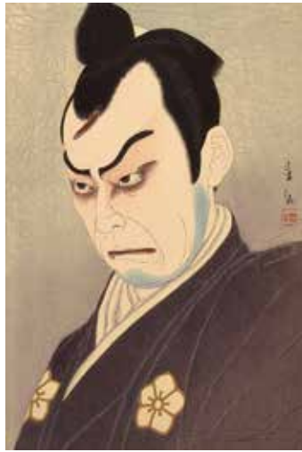
名取春仙 《初代中村吉右衛門 馬盥 光秀》

開館時間／9:30～17:00(入館は16:30まで) 入館料／一般320円、大高生260円、中小生160円 *入館料には団体割引などがあります。 小学生未満・65歳以上の方は無料です。 *小・中・高生は毎週土曜日は無料です。 休館日／12月7日(月)、14日(月)