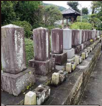
戦没者の墓 (市内の各寺院など) ※写真は了円寺 飯野新田

お寺の境内のよく目立つ場所に、戦没者の碑やお墓が設けられていることがある。戦没者の墓は、墓石の上面が四角錐に少し尖っているため、すぐに見分けられる。墓石には戦没地が刻まれ、当時の人々がアジア太平洋地域の、実に様々な場所で亡くなったことを教えてくれる。