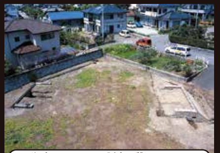
ろたこ えんたいごう ロタコ跡3号掩体壕 (飯野)

戦前の金属回収令によって失われた鐘を、先代の住職が戦没者の慰霊と平和への祈りを込めて、托鉢により広く浄財を集め、再興した鐘。内側には、西郡の集落ごとに戦没者 951 名の名前がびっしりと刻まれる。その後ヒビが入ったため、現在は本堂西側に安置されている。