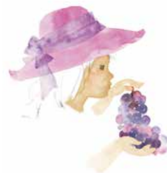
いわさきちひろ《ぶどうを持つ少女》

南アルプス市立美術館 〒400-0306 南アルプス市小笠原1281 お問合せ／TEL 282-6600 FAX 282-6601 Minami Alps City Museum of Art