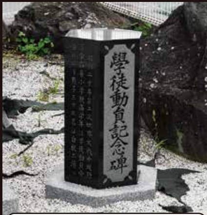
学徒動員の碑 (白根飯野小学校 飯野)

お寺の境内のよく目立つ場所に、戦没者の碑やお墓が設けられていることがある。戦没者の墓は、墓石の上面が四角錐に少し尖っているため、すぐに見分けられる。墓石には戦没地が刻まれ、当時の人々がアジア太平洋地域の、実に様々な場所で亡くなったことを教えてくれる。