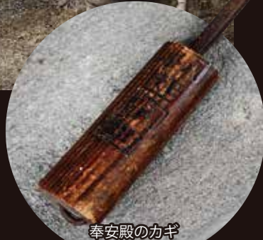
奉安殿のかぎ 八田学校の焼印がみられる

現在の南アルプス市百々、上八田と旧八田村域の子どもたちが通った旧八田小学校(国民学校)の奉安殿も、他の多くの学校の奉安殿同様、GHQの指令に基づき、戦後解体された。しかしその後、地域の有志により徳永の長盛院境内に移築され、現在は戦没者の位牌と遺影、遺骨が納められ、その慰霊の場となっている。春のお彼岸には、遺族によって、秋のお彼岸には、地元徳永区によって、今もここで慰霊祭が行われている。