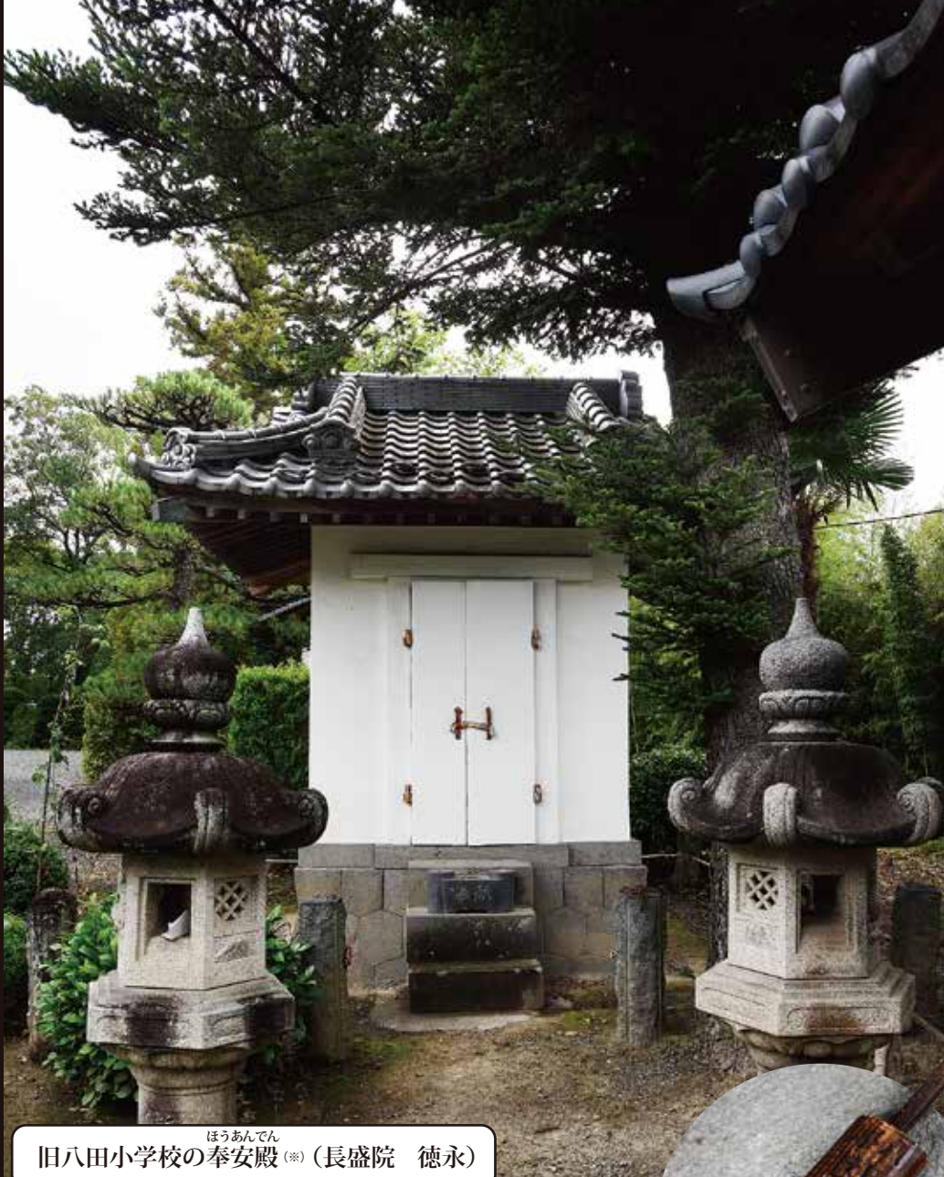
ほうあんでん 旧八田小学校の奉安殿(※) (長盛院 徳永)

現在の南アルプス市百々、上八田と旧八田村域の子どもたちが通った旧八田小学校(国民学校)の奉安殿も、他の多くの学校の奉安殿同様、GHQの指令に基づき、戦後解体された。しかしその後、地域の有志により徳永の長盛院境内に移築され、現在は戦没者の位牌と遺影、遺骨が納められ、その慰霊の場となっている。春のお彼岸には、遺族によって、秋のお彼岸には、地元徳永区によって、今もここで慰霊祭が行われている。