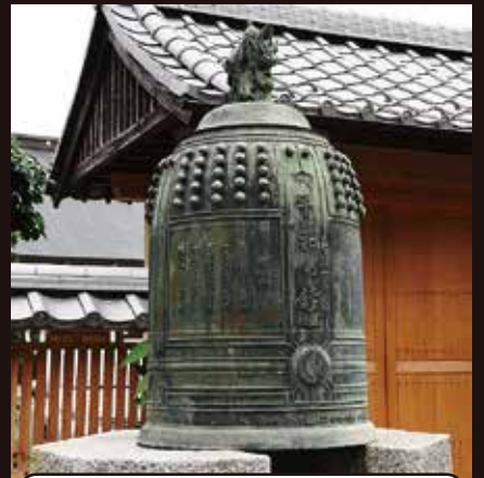
平和の鐘 (長谷寺 榎原)

旧豊村 (現在の南アルプス市十五所、沢登、上今井、吉田) が分村して、満州 (現中国東北部) に移住した開拓団が、終戦直後に中国大陸で孤立し、集団自決して村人 140 人が爆死するなどした悲劇を伝える。現在も事件のあった8月17日にはここで慰霊祭が行われている。