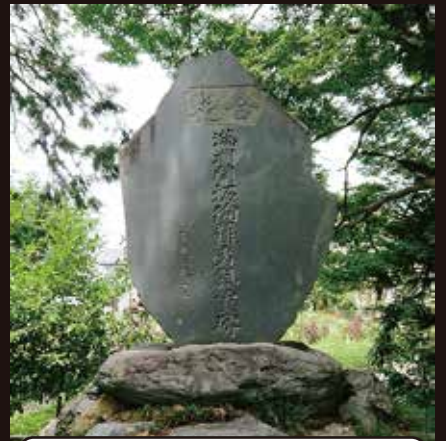
満州開拓受難者慰霊碑 (諏訪神社 吉田)

旧豊村 (現在の南アルプス市十五所、沢登、上今井、吉田) が分村して、満州 (現中国東北部) に移住した開拓団が、終戦直後に中国大陸で孤立し、集団自決して村人 140 人が爆死するなどした悲劇を伝える。現在も事件のあった8月17日にはここで慰霊祭が行われている。