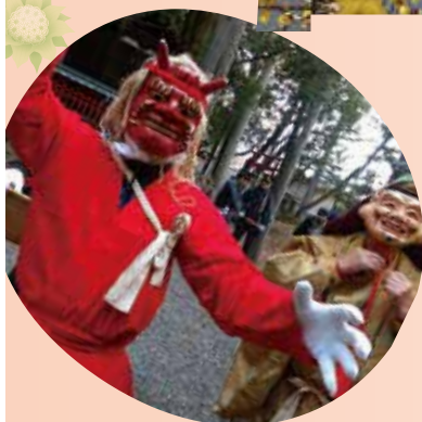
若宮八幡神社の鬼やらい（古市場）

こうした節分の行事は「お歳とり」とも呼ばれました。立春は新しい年の始まりと考えられたからです。こうした節目の日には神霊が訪れると古くから信じられてきました。庭に掲げられた鬼の目も本来は神霊が宿るための依代だったのでないか、という意見もあります。つまり鬼とは災いをもたらす邪悪な存在であるばかりではなかったのかもしれない。南アルプス市域はユネスコのエコパークに登録され、自然と人が調和し、ともに生きることを目指しています。節分は人々が自然の猛威と戦いながらも、敬い、その恵みに感謝し、新たな春に幸福を祈る祭りです。こうした伝統文化には今後自然と向き合っていくための知恵や記憶が秘められているのです。