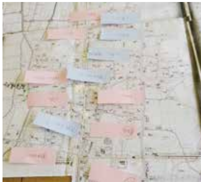
▲地図に付箋を貼って高齢者の生活の様子を把握しました

今まで気づけなかった心配な高齢者が地域の中にいることがわかり、高齢者が元気で暮らしていくためにできることはないかを考えていきました。