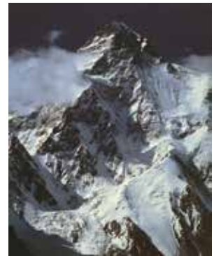
《K2峰 8611m ゴドウィン・オースチン氷河から》

本展では、ザ・グレート・ヒマラヤ、ザ・グレート・カラコルム、カナディアン・ロッキーズの中から約40点を厳選し、氏の半世紀にわたる活動を紹介いたします。