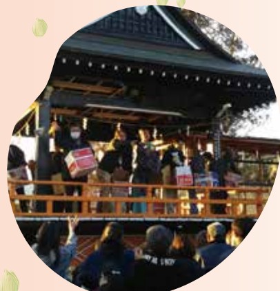
鏡中條の巨摩八幡宮でも毎年豆まきが行なわれます