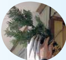
玄関に飾られたヤキカガシ（沓沢）

昔は煎る前に12粒とっておいて、月毎に火鉢で焼いて、月の天気を占いました。汗をかかなか雨、ふきだせば風、乾けかひでり