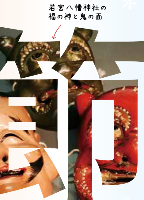
若宮八幡神社の福の神と鬼の面

庭先には、竿の先に目籠か手すくい（うどんすくい）とバリバリの木をつけて軒先よりも高く掲げました。これは「鬼の目」と呼ばれました。準備が整うと豆まきの始まりです。煎った豆はまず神棚にお供えしてから各部屋にまきます。まく順序はその年の恵方や南東からなど家庭や地域によってさ