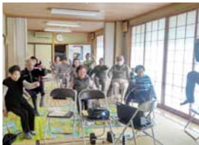
▲百歳体操体験会の様子 (鏡中條公民館)

下村区では、回覧板で参加を呼びかけ、昨年12月11日に「百歳体操体験会」を開催しました。そして、参加者の「元気になりそう」「続けてやってみたい」という声に押されて、今年2月18日から、本格的に百歳体操をスタートすることが決まりました。良いことは難しく考えずにやってみることで、元気な地域になっていきます。