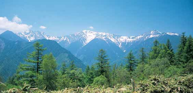
▲初夏の夜叉神峠から白峰三山