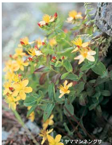
ミヤママンネングサ