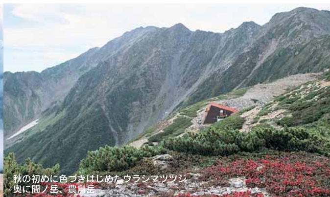
秋の初めに色づきはじめたウラシマツツジ 奥に間ノ岳、農鳥岳