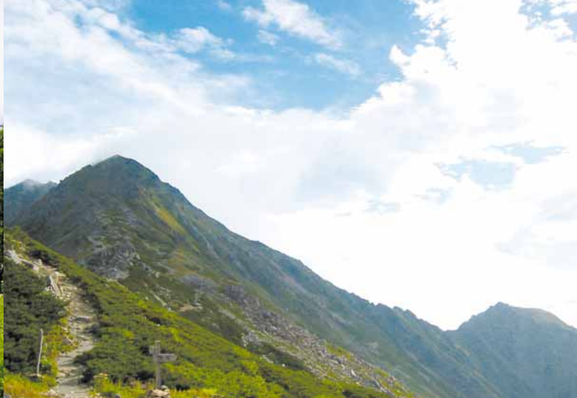
▲北岳山荘から北岳山頂