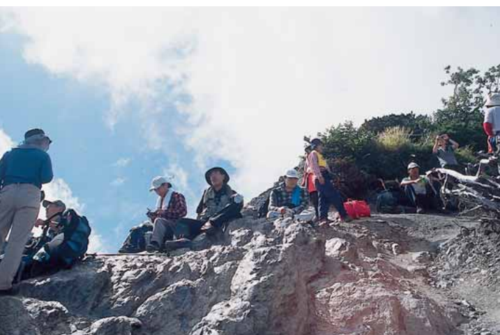
▲八本歯コル付近で休憩する登山者

市となった今、果樹観光と並んで主軸となる南アルプスの観光について、温泉や市内の他地域との連携など、様々な実情を踏まえる上で、観光開発と自然保護の両立を考えながら、山の魅力を市内外の多くの人たちに知らせるにはどんな方法が最も望ましいのか、再びやってくる登山シーズンに向けた対応が迫られます。