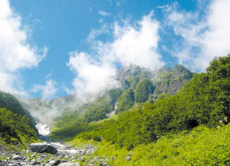
▲大樺沢から雲にけむる北岳