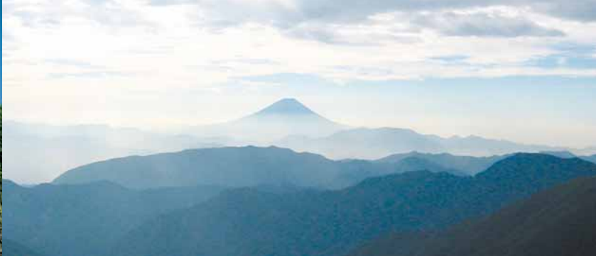
▲北岳山頂付近の稜線から富士山 手前に横たわるのは櫛形山