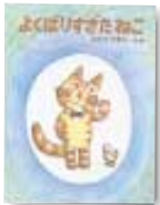
児童書 さとうわきこ著 PHP研究所

よくばりすぎたねこ ある日、ねこがひよこを見つけてました。「つかまえたらまるやきにしてたべよう。」「いやまてよ、これを大きくしてたべたっていいじゃないか。」ねこはいろいろ考えてひよこを育てるのですが……。