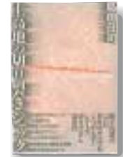
一般書 島田荘司著

山菜と木の実の図鑑 春まつさかり。山菜採りに出かけてみませんか。見つけ方、採集法、調理法などを写真と共に解説。