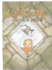
児童書 たつみや章著 あかね書房

わたしたちは平和をめざす 人は争いをやめることができるのでしょうか。世界中の子どもたちの平和への願いを聞いてください。