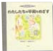
児童書 黒田貴子著 大月書店

よくばりすぎたねこ ある日、ねこがひよこを見つけてました。「つかまえたらまるやきにしてたべよう。」「いやまてよ、これを大きくしてたべたっていいじゃないか。」ねこはいろいろ考えてひよこを育てるのですが……。