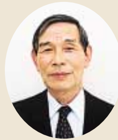
議長 稲山徳仁議員