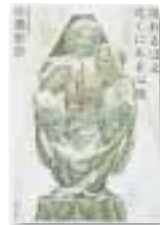
一般書 佐藤智加著 河出書房新社

冥界伝説・たかむらの井戸 あの世につながっているという伝説の井戸。探検にきた悟が出会ったのは、冥界に帰れなくなった迷子のおぼけだ。おぼけと少年の友情を描いたファンタジィ。