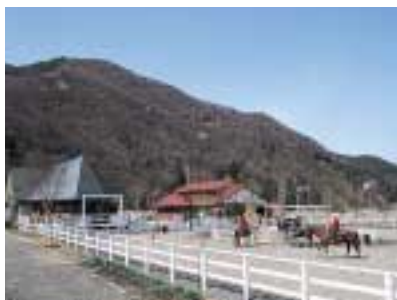
県道竜王芦安線を芦安に向かい、信号「堀沢入口」を右折