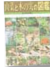
一般書 おくやまひさし著 ポプラ社

壊れるほど近くにある心臓 僕等は互いを抱き潰してしまってもいい。兄と姉と弟の生活が狂い始めて……。文芸賞受賞第1作