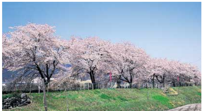
徳島堰沿いの桜並木

国道52号線荊沢交差点右折、陸橋を渡りすぐ右折し川沿いに進み広城農道トンネル手前を左折した丘の上