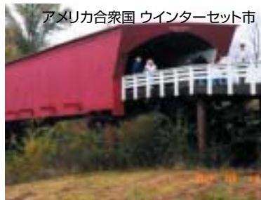
アメリカ合衆国 ウインターセット市

マーシャルタウン市と州都デイトンをはさみ反対側に位置する、人口5000人の静かな市。旧白根町と平成11年から交流があり、平成15年11月訪問した際、調印。