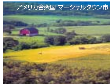
アメリカ合衆国 マーシャルタウン市

マーシャルタウン市と州都デイトンをはさみ反対側に位置する、人口5000人の静かな市。旧白根町と平成11年から交流があり、平成15年11月訪問した際、調印。