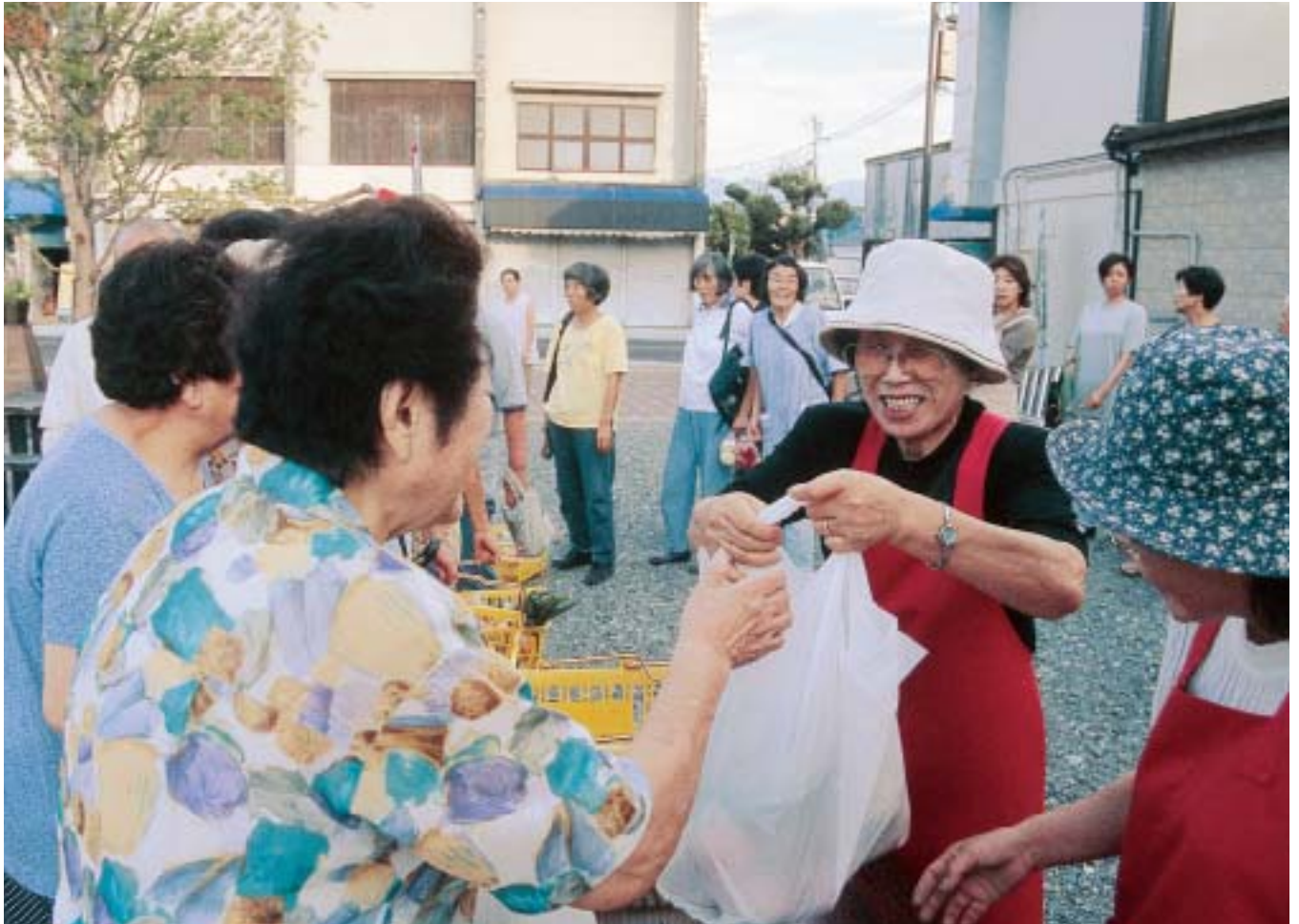
新鮮な野菜が笑顔で手渡される夕市

全国的に知られる市の名称「南アルプス」。それが知られるに至った理由は「アルプス」という言葉に由来する良いイメージがあります。 「きれいなところで収穫された野菜や果実はさぞ美味しいだろう」そんな良いイメージを持った消費者に対して、これに恥じない「もの」を、良いまちに住む生産者が作って提供する。それが評価されることによって「南アルプス市」のイメージアップとなり、生産者のやりがいにも繋がります。これは決して市外にばかり目を向けたことではなく、市内に住む人にも言えることです。 地元でとれた良いものを、地元で食することができる環境。「良いものを地元のみんなに食べてもらいたい」という気持ちと、「あの人がつくったものなら安心」という気持ち。消費者に生産者の顔が見えることによる信頼感と安心感が人と人との良い関係を築き、地元の農産物を地元で消費することを通じ農業の活性化となり、健康で良いまちづくりにも繋がるはずだからです。