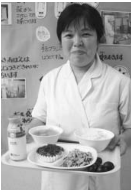
この日の献立はごはん、牛乳、イワシハンバーグ・枝豆のサラダ・サツマ汁・巨峰(ぶどう)。イワシハンバーグとサツマ汁のネギ、枝豆サラダの枝豆も子ども達が学校で育てたもの。大根やサツマイモ、みそはほたるみ館を通じて地元から提供していただいたものです。

地域の協力を得ながら、地場産物を生かし郷土食・行事食を傳承し、子どもたちの生涯にわたる健康づくりの基礎ができればと思っています。そして、大人になつたとき、給食で食べた「あの味」を思い出せるような本物の味がわかる味覚づくりをみんなであつていければいいなと思っています。