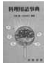
大滝緑/山口米子 編著 真珠書院

料理用語事典 世界各国の料理名、調理方法、調理操作、食材、調味料・スパイス、菓子、飲料、酒、器具など基本の料理用語3200余を収録。料理関係の基礎知識から新しい用語までを網羅する。