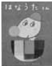
丸山もも子 作 主婦と生活社

はなうたくん ちよっぴりささくれたり、さびしくなったり、つまんなくなったり…。そんなときはポケットに手を入れてこらん。はなうたくんがあらわれるよ。あつたかい気持ちになれる絵本。