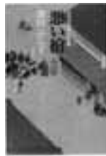
澤田ふじ子 作 幻冬社

悪い棺 米屋の主・十左衛門の棺がけて石を投げた少年・修平。亡き十左衛門の極悪非道を訴える修平を助けようと菊太郎は一計を案じ…。公事宿の居候・菊太郎の活躍を描くシリーズ第9弾。NHK金曜時代劇「はんなり菊太郎」原作。