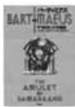
ジョナサン・ストラウド 作 理論社

バーティミアス 魔術師たちが支配するロンドン。魔術師の卵少年ナサニエルは妖霊バーティミアスを召喚し、邪悪なエリート魔術師サイモンが奪ったサマルカンドの秘宝「護符」をめすみ出す。ファンタジー3部作の第1弾。