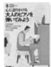
野入葉子 著 ナツメ社

心に語りかける大人のピアノを弾いてみよう 「ピアノを始めたい」「昔習っていたけれど、もう一度弾いてみたい」「あの名曲を弾けたら…」という大人に贈る、CD付きのピアノ入門書。レッスン形式での丁寧な解説がおすすめ。