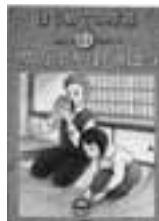
秋山 滋 作 汐文社

はじめの茶道 日本に古くからある茶道を理解するための入門書。1巻目では抹茶とは何かから、お茶会に行くための準備、服装、歩き方、すわり方、お菓子とお茶をいただくまでを紹介。