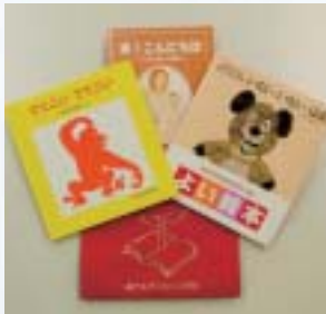
福音館書店 「でてこいでてこい」 はやしあきこ/さく

「赤ちゃん」と絵本を開くひとときの楽しさや大切さ「や」地域ぐるみで子育てを応援しています」といったメッセージを図書館職員が直接保護者に伝えています。