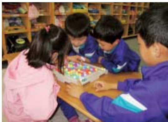
放課後児童クラブを利用している子どもたち

保護者が就業等により、昼間家にいない小学校3年生までの児童を対象にして行っているもので、現在17カ所700人以上が利用しています。