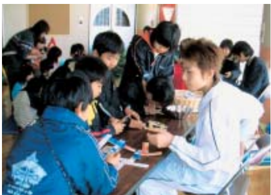
小学生から高校生まで大勢が参加して行われた児童館まつり