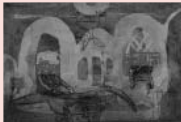
LIMPIEZA DE ANA

開館時間 午前9時30分～午後5時(入館は午後4時30分まで) 休館日 月曜日・祝日の翌日 入館料 一般300円・大高生250円・中小生150円 お問合せ Tel.282-6600