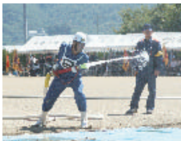
ポンプ車操法を行う八田分団の選手

南アルプス支部の代表として、連続優勝と10月に神戸で開かれる全国大会出場を目標に、小型ポンプ操法の部に出場した若草分団第7部(浅原)は、わずか1秒の差に泣き、惜しくも準優勝となりました。また、ポンプ車操法の部に出場した八田分団は、選抜チームを結成して大会に臨みましたが、こちらも準優勝に終わりました。厳しい訓練に耐え抜き、見事な成績を収めた両分団には、会場から大きな拍手と声援が贈られました。