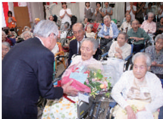
白根聖明園に入所している高齢者に 祝い金と花束を贈りました