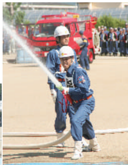
小型ポンプ操法を行う若草分団第7部の選手