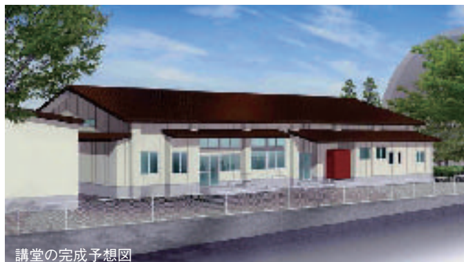
講堂の完成予想図