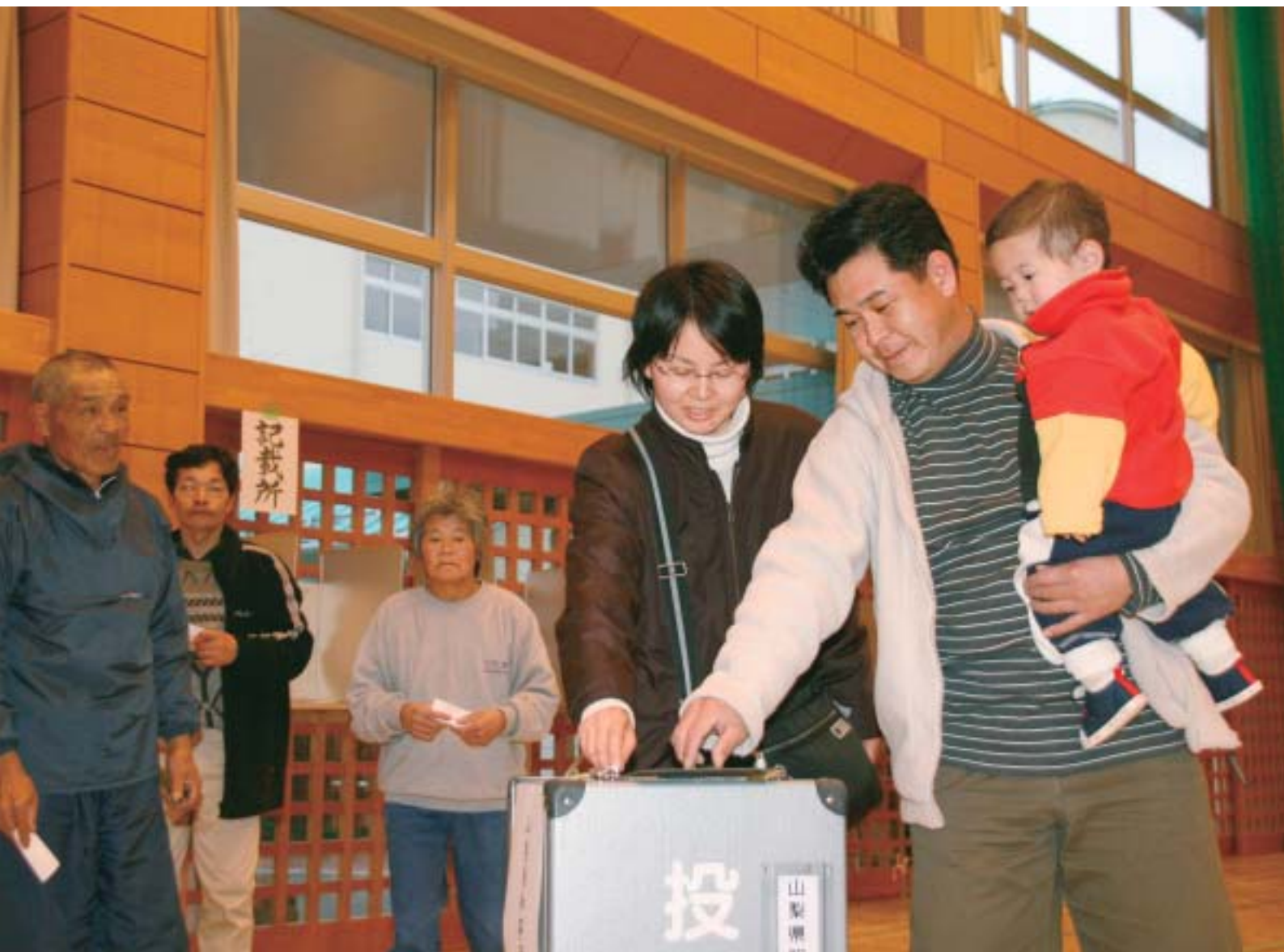
若草南小学校体育館 (第23投票所)