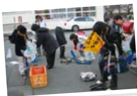
地域環境美化作業