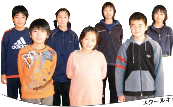
スクールキッズ：児童会役員

今年度の児童会活動は『やまなし』をテーマに、たてわり班活動、あいさつ運動、クリーン活動などに取り組んでいます。