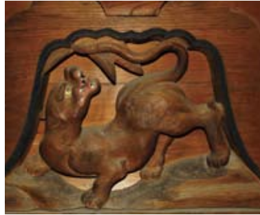
本尊が安置してある須弥壇を飾る白狐の彫刻