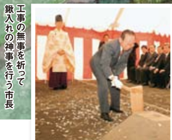
工事の無事を折って 鎮入りの神事を行う市長