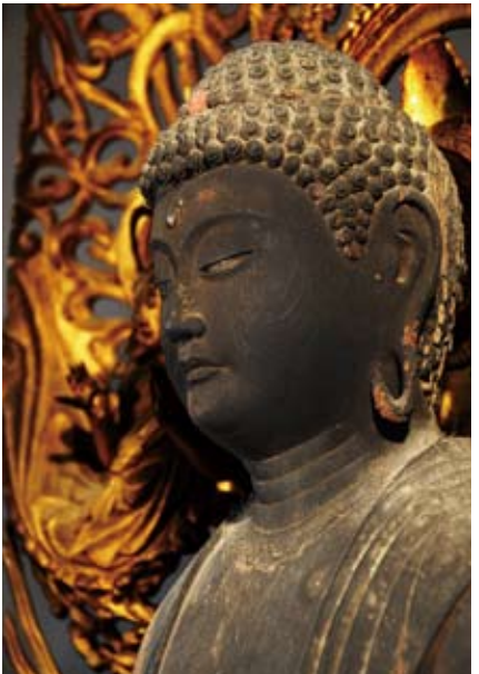
本尊は鎌倉期のものといわれる木造阿弥陀如来立像で県の指定文化財です。一昨年には県立博物館開館1周年記念特別展「祈りのかたち一甲斐の信仰一」で南アルプス市を代表する仏像として紹介されました。

今年1月20日には常楽寺において「文化財防火デー消防訓練」が実施されました。初期消火訓練、通報訓練、文化財搬送訓練、放水訓練等を常楽寺及び檀家さんと地元消防団の協力で行なわれました。大切な文化財を地域の人たちで守っていききたいですね。