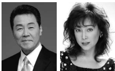
五木ひろし 柏原 芳恵