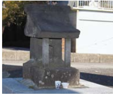
門前にある白狐の祠