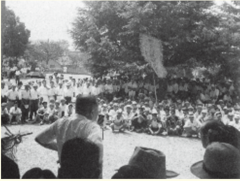
水の多い地域の人々が県庁前に集まり、反対陳情を続けました。

水に乏しい原方(田んぼが作れない地帯)と水が豊富な田方(田んぼが作れる地帯)の戦いは、徳島堰が完成した江戸時代から明治、大正、昭和に続く中で、何度となく繰り返されてきたんだ。