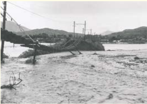
水害で多くの田畑などが被害を受けていました。