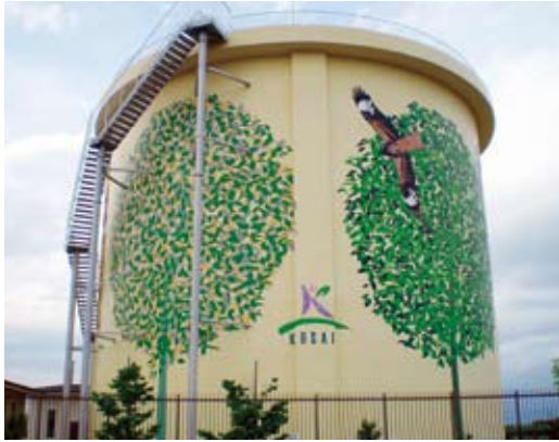
甲西地域の一部に配水している水道タンク