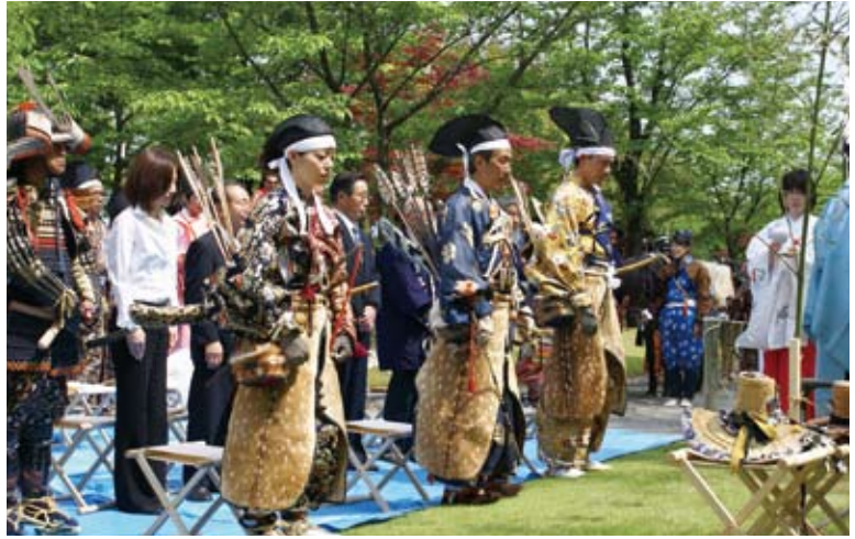
アヤマフェアの流鏝馬は小倉藩主小笠原惣領家に伝わる小笠原流流鏝馬を受け継ぐ源長統一門による演舞です。