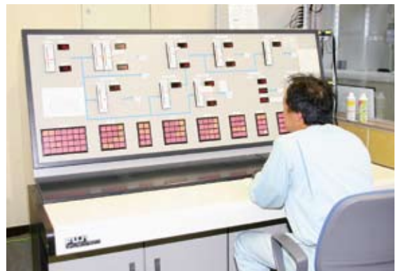
集中管理システムで24時間体制で情報を管理

市が運営している水道水は、企業局内にあるテレメーター（集中管理システム）が24時間体制で情報管理を行っており、ポンプの停止や