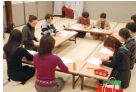
小笠原流礼法講座の様子