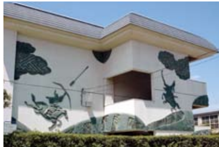
小笠原小学校舎のレリーフ 長清の業績をたたえ、館跡と伝わる校舎には 武芸の様子が描かれています。