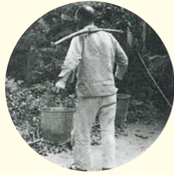
水がない地域は、汲み上げた水を天秤棒をかっいで家まで運んでいた。