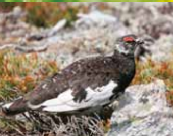
繁殖期を迎えたライチョウのオス。南アルプスのライチョウは、世界の一番南に生息しており、絶滅が危ぶまれています。