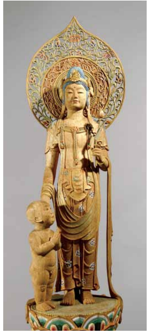
慈母観音立像 作者は彫刻家の西山如拙

※ここに紹介した慈母観音像や 日蓮上人坐像は、通常一般公開 されているものではありません。