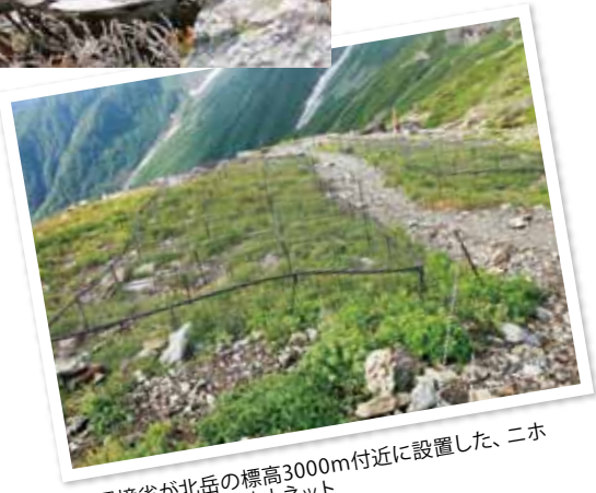
環境省が北岳の標高3000m付近に設置した、ニホンジカ用の食害防止ネット