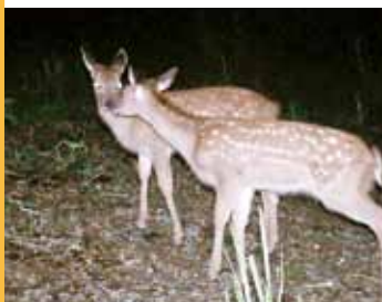
夜間になると裸山（櫛形山の4つの峰のうちの1つ）にも多くのニホンジカが出没します。