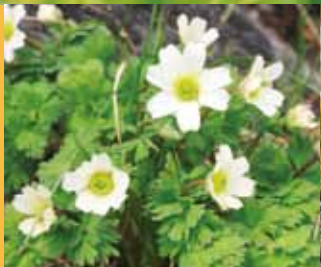
世界で北岳にしかない「キタダケソウ」この可憐な花も絶滅が危ぶまれています。