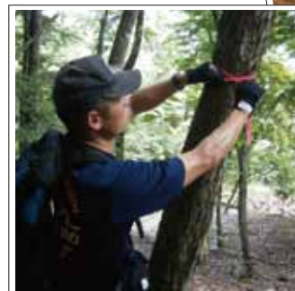
ケガ人を背負う訓練