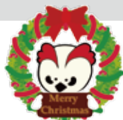
図書館キャラクター ライライ

パネルシアター・人形劇など楽しいことがいっぱい。 サンタさんからのプレゼントもあります！