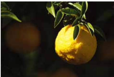
写真はいずれも平岡の柚子

もう師走です。せわしない日々を過ごされている方も少なくないと思いますが、たまには冷えた体をゆず湯で温めて、ゆつくりとくつろぐ時間があると良いですね。