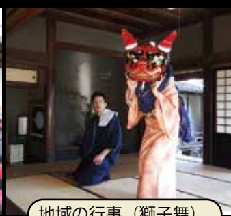
地域の行事(獅子舞)