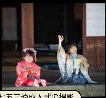
七五三や成人式の撮影

お貸しする際、敷地全体を広く占用する場合などは、一般の来館者の方の観覧も妨げないような(いつしよに楽しんでもらえるような)、活用をお願いします。たとえば、具外からわざわざお越しいただいたお客様に「今日は貸し切りなので中をご覧いただけません」とは申し上げたくありません。それよ