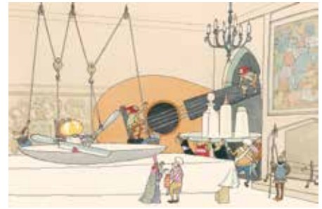
おおきなもののすきなおうさま

住所／〒400-0306 南アルプス市小笠原1281 お問合せ／TEL.282-6600 FAX.282-6601 開館時間／9:30～17:00(入館は16:30まで) 入館料／一般500円 大高生300円 中小生200円(20名以上団体料金2割引) 今月の休館日／10日(火)・16日(月)・23日(月)・30日(月) 展示替休館日／2日(月)～6日(金)