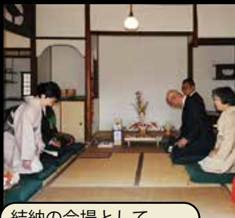
結納の会場として