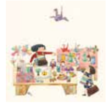
おたより (しぜんのくにに1978年3月)