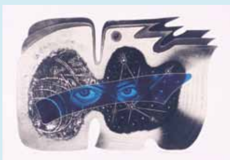
《凍れる歩廊(ベーリング海峡)》銅版 1978年 49.5×74.5cm