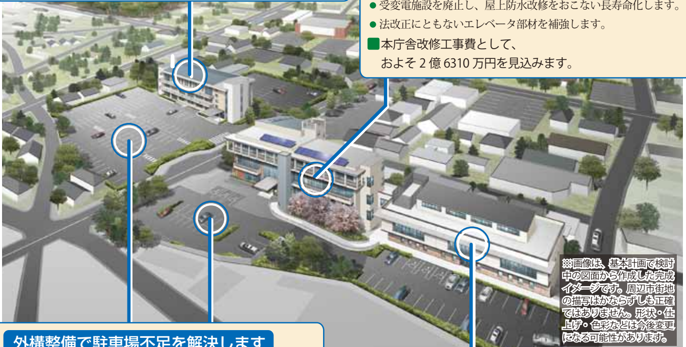
※画像は、基本計画で検討中の図面から作成した完成イメージです。周辺市街地の描写はかならずしも正確ではありません。形状・仕上げ・色彩などは今後変更になる可能性があります。