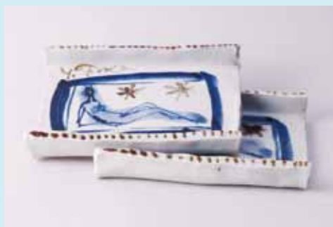
《白磁に呉須絵の皿》陶芸 1970年代 13.4×19.6cm