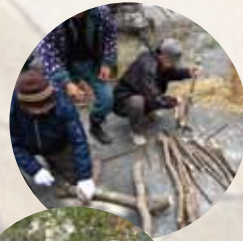
ヌルデの木をオデクに仕上げる