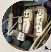
鳥居やろ、刀、子宝を願った男女性のシンボル