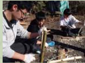
弓矢・刀を作る：沓沢