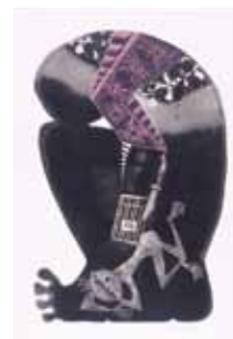
《アシェンダの地下にて》