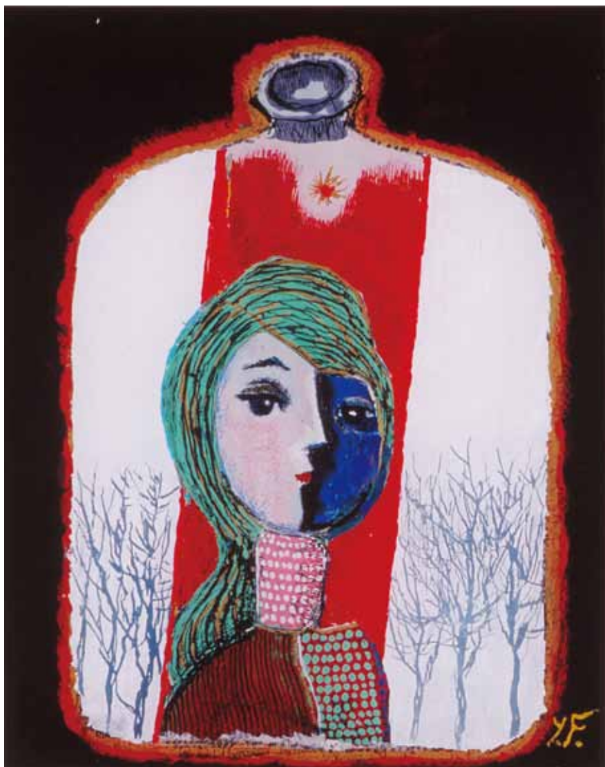
《白い夢の壺》ガラス絵 2006年 27.0×22.0cm

新春の1月2日に、戦後日本の版画界を牽引してきた深沢幸雄さんが、92年間の作家人生にピリオドを打ちました。南アルプス市立美術館では、心からご冥福をお祈りし、その偉大なる作家人生を辿りながら、深沢幸雄追悼展を開催しています。