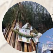
木材を集めて作ります