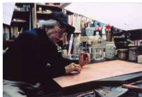
銅版の細部に手を入れる