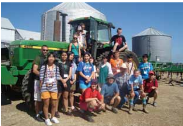
【マーシャルタウン市への訪問】 トウモロコシ農場のスケールの大きさに感動