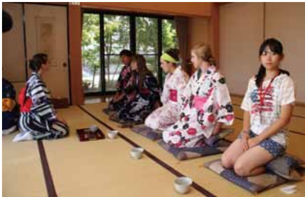
【ウィンターセット市からの訪問】浴衣に着替えて茶道を体験