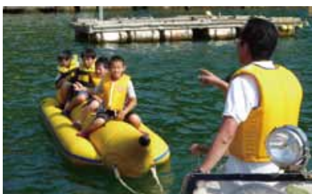
【穴水町への訪問】 スリル満点のパナナボートを体験