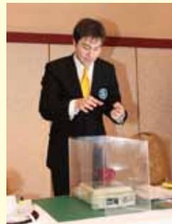
いよいよ重量を計測（わずかな風も影響するため四方を囲っています）