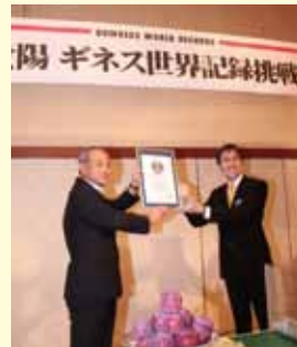
認定証を受け取る市長