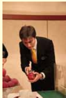
外周や直径などの大きさを計測