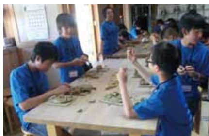
【津別町からの訪問】 若草瓦会館で鬼面瓦づくりに挑戦