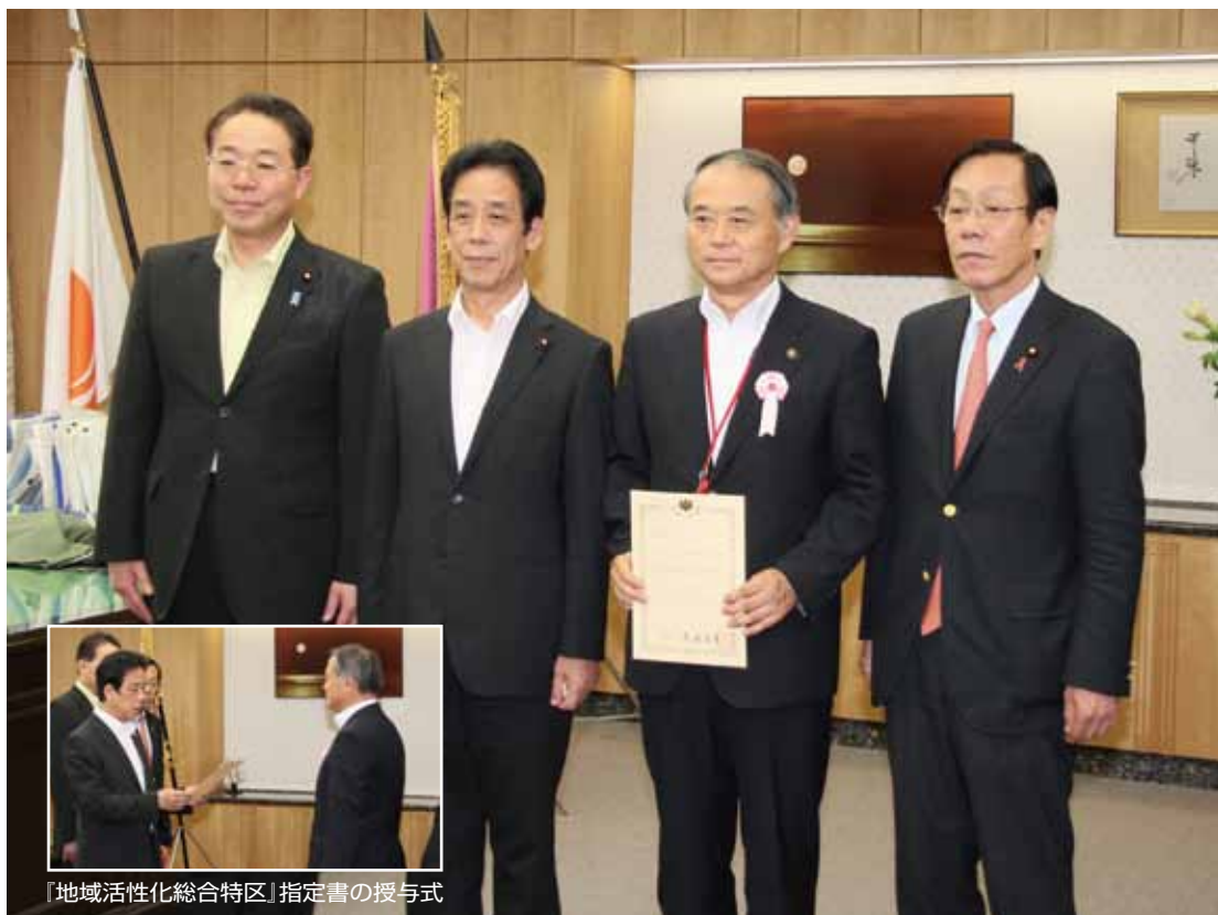
「地域活性化総合特区」指定書の授与式

「6次化のまちづくり」による地域活性化モデルの構築に向けた第一歩 南アルプス市が地域活性化総合特別区域の指定を受けました。