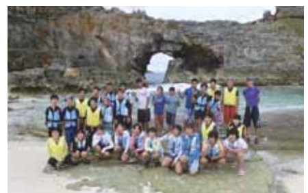
【小笠原村への訪問】 世界遺産 小笠原諸島の南島で自然を満喫