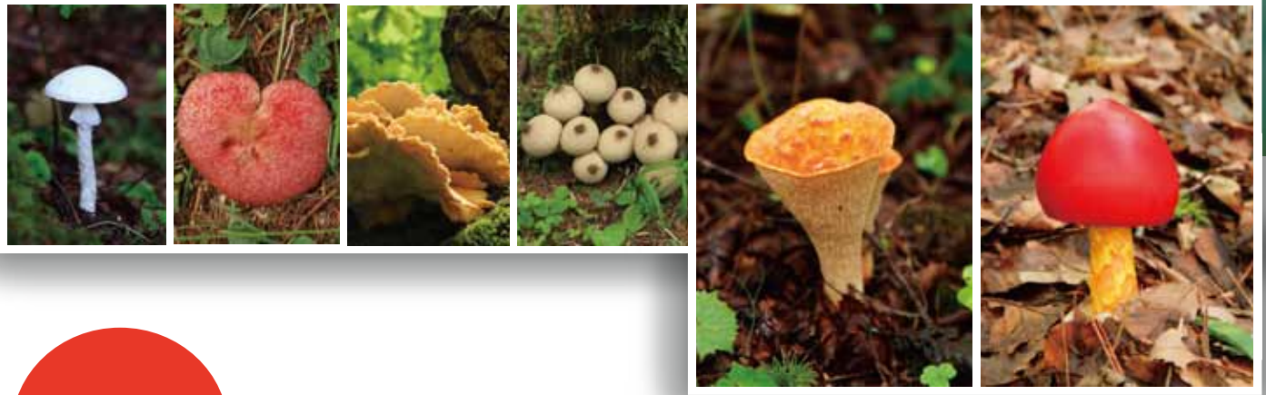
ウスタケ (左) とタマゴダケ (右)