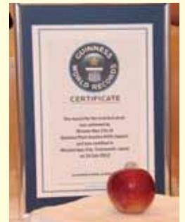
ギネス認定証と登録された貴陽

7月24日、本市生まれのスモモの高級品種「貴陽」が、「重さが世界一」のスモモとしてギネス世界記録に認定されました。