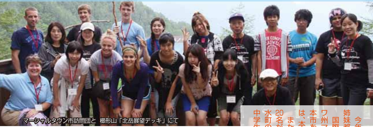
マーシャルタウン市訪問団と 檜形山「北岳展望デッキ」にて