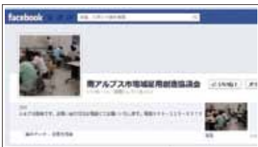
●協議会の facebook ページ 今後、就職や起業を支援する各種情報を発信します。

求職者と企業の合同就職面接会を来年1月に開催する予定です。また、求職者や創業者に向けた情報をフェイスブックなどでも随時お知らせしていきます。