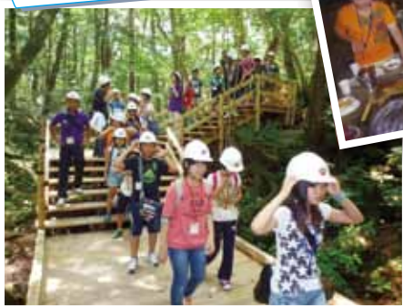
▲西湖の「コウモリ穴」に続く森を歩く