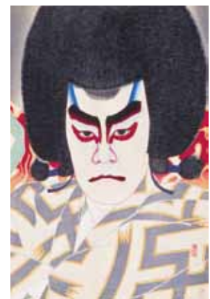
【二代目市川左団次 鳴神】