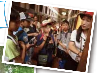
▲網走監獄(昔の網走刑務所の建物)を見学しました。