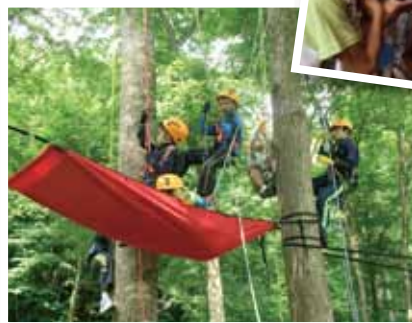
▲「ツリーイング」という木登り体験での眺めは最高でした。