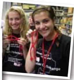
▲ふるさと文化伝承館で小笠原流礼法の「叶結び」を体験。