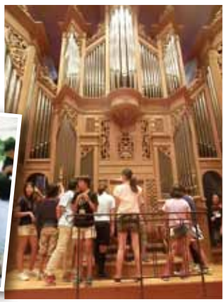
▲国内最大級のパイプオルガンの音色を楽しみました。