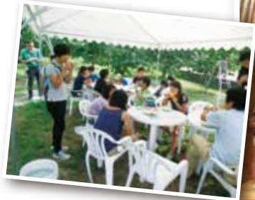
▲市内の農園でもぎたての桃を堪能。「おいしい!」の聲が上がりました。