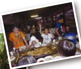
▲夜は樹園のバーベキューで盛り上がりました。