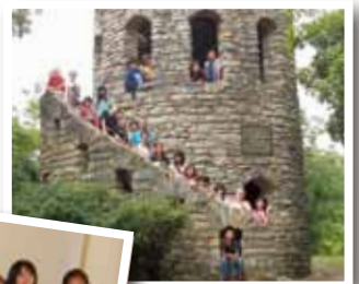
▲ウィンターセット市公園で、開拓者の名前がついた、「クラークタワー」に登る。