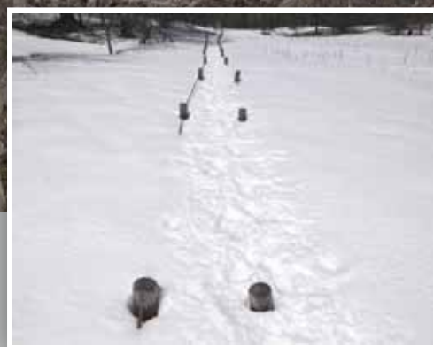
雪に埋もれる北尾根登山道

「暑さ寒さも彼岸まで」季節の移り変わりを先人たちはこう言い伝えてきました。とりわけ今年の冬は寒さが厳しく、暖かな春を待ち望む想いは誰もが募らせていることでしょう。春一番の南風が吹いたかと思えば、北風も荒々しく吹き荒れる…そんな春と冬がおしくらまんじゅうをしているかのようで季節の移り変わりを日々感じています。