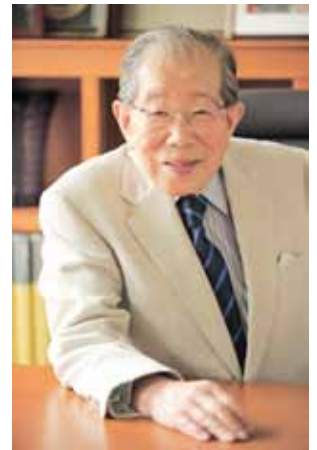
日野原先生