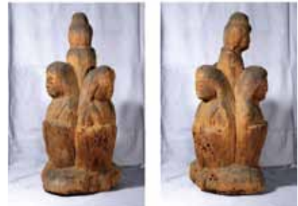
神像の全体 如来形の半身を3躯の女神が囲む他に例のない造形を見せます。

市内で5か年にわたり実施してきた、この木造浅間神像を含む、仏像や神像の調査成果を美しい写真とともに紹介した報告書です。現在一般に販売中です。