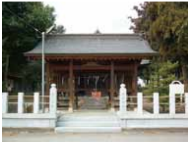
江原浅間神社 古代大井郷の中心として、ふるくから信仰をあつめてきました。