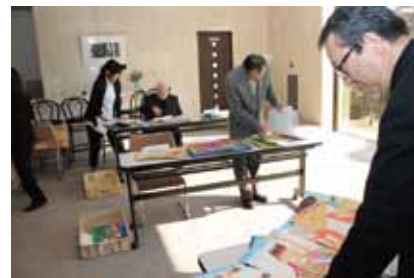
春仙美術館で作品審査が行われ、入賞作品が決定しました。

【第2回 南アルプス市絵画コンクール】展の詳細は10ページの「美術館だより」をご覧ください。