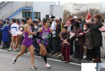
南アルプスAチーム