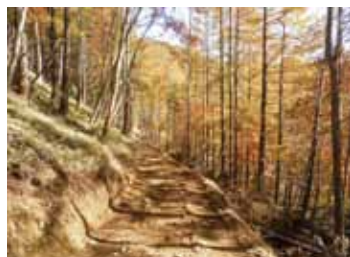
整備が進む櫛形山トレッキングコース