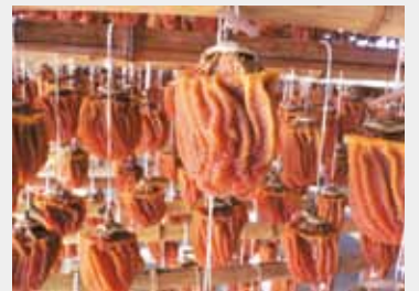
ずらりと並ぶ「枯露柿」たち

さて、干し柿づくりの現場をのぞいてみましょう。ということで、突撃(?)訪問させていただいたのは、高級フルーツ店にも並ぶという、おいしい枯露柿を生産している「叶屋」さん。