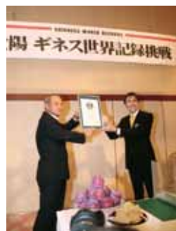
貴陽がギネス世界記録に認定