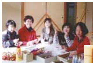
三世交流で子どもたちと工作

地域で活動する人や民謡の団体などが集まり平成14年4月に設立され、体育祭やスポレク祭への出場、地域のイベントの参加、民謡の講習会など、