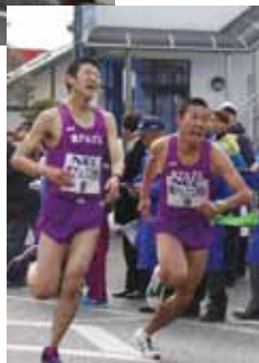
南アルプスBチーム