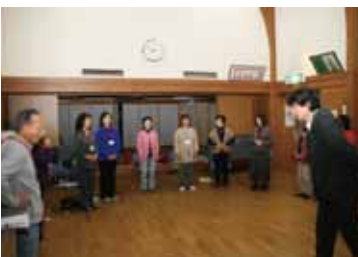
南アルプス桃源座の練習風景

また、『第2回全国シニア 演劇大会』を南アルプス市で 開催し、本市シニア劇団の「南 アルプス桃源座」が参加しま す。健康長寿のまちにふさわ しい熟年世代の活躍が光るイ ベントになることを期待して おります。