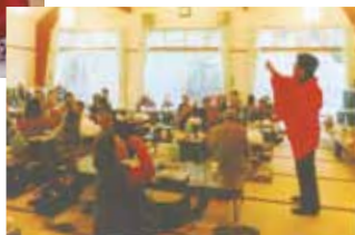
高齢者の集いでリズム体操を参加者と楽しむ

地域活動の活性化と市民の交流を目的に様々な活動を行なっています。また、地域のサロン活動が活発にできるようレクの支援なども継続して行っています。