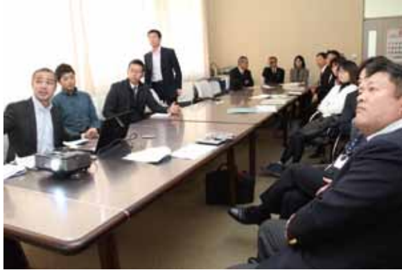
ビッグテンイヤープロジェクト打合せ風景