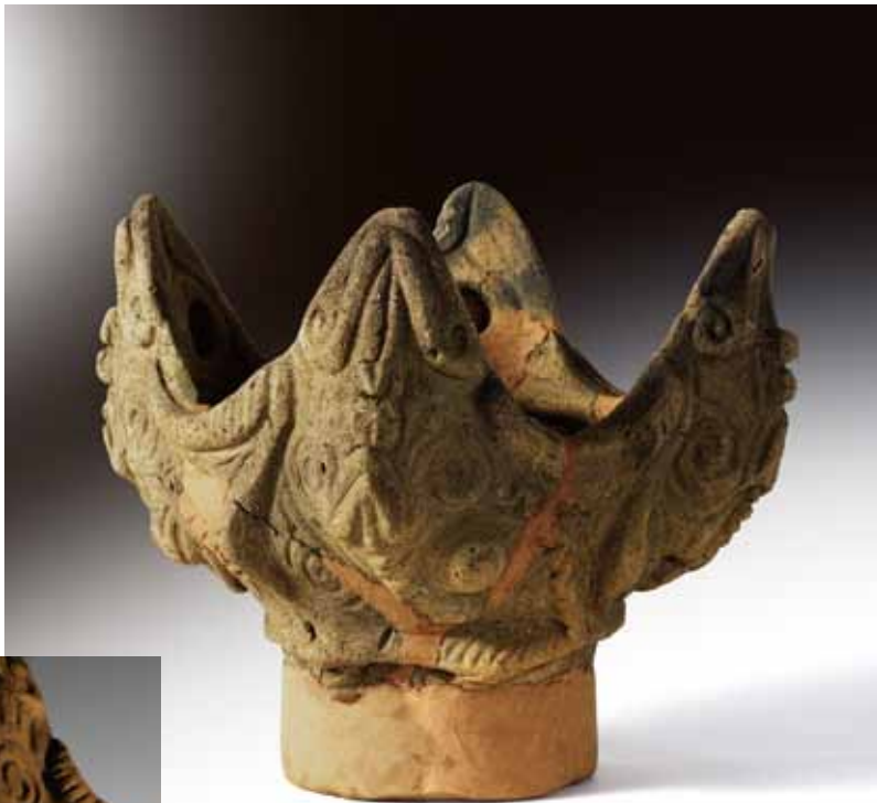
北原C遺跡出土土器

新年最初の「ふるさとの誇り」は、今年の干支にちなんで、文化の中のへび、とりわけ南アルプス市に伝わるへびにまつわるエピソードを集めてみました。