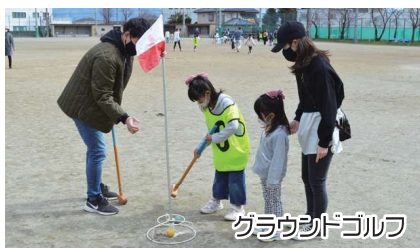
グラウンドゴルフ