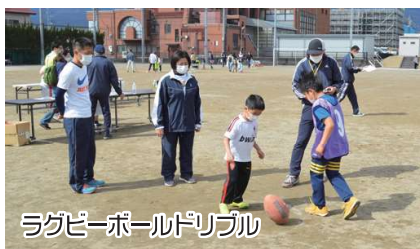
ラグビーボールドリブル