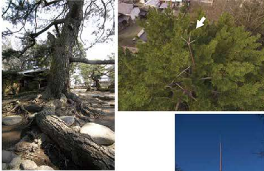
(右上)マツのてっぺんに設置された避雷針。ドローンによる撮影。 (右)現在安藤家を守る避雷針。 (左上)マツの根まわりも、見ごたえがある。

避雷針の歴史に詳しい方によれば、明治時代に木に避雷針を取り付けたという事例は、当時では珍しく、また、現在設置されている避雷針がその当時のものであれば、その時代のものが残っていること自体も大変珍しいことなのだそうです。 安藤家を落雷から守ってきた「避雷針のマツ」ですが、現在は、敷地内に、より高い避雷針が別に設置されたことにより、実質的にその役割を終えています。 写真ではなかなか伝わりにくいのですが、実際に見ると、その大きさに圧倒されるはず。ぜひ一度、訪れてみてはいかがでしょうか。安藤家住宅は、年明け一月八日から営業。毎週火曜日が休館日です（この日が国民の祝日にあたる時は開館し、翌日が休館となります）。 文／写真 文化財課