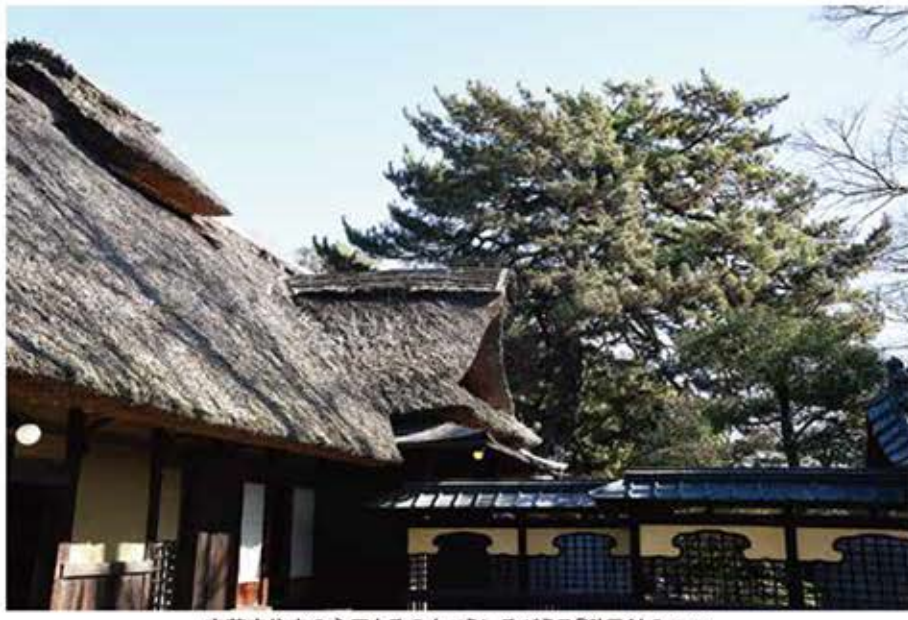
安藤家住宅の主屋とその向こうにそびえる「避雷針のマツ」