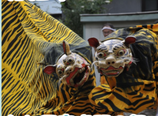
台ヶ原宿虎頭の舞