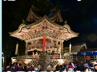
高尾穂見神社夜祭