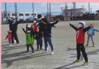
▲ラジオ体操・ストレッチ