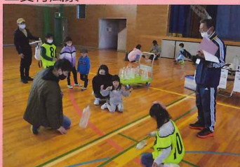
▲ペットボトル立たせ