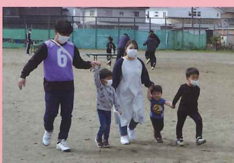
▲ドタバタ・ウォーキング