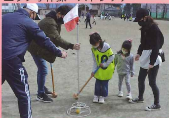
▲グラウンドゴルフ