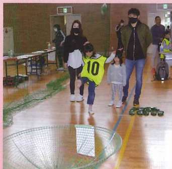
▲シューティングスリッパ