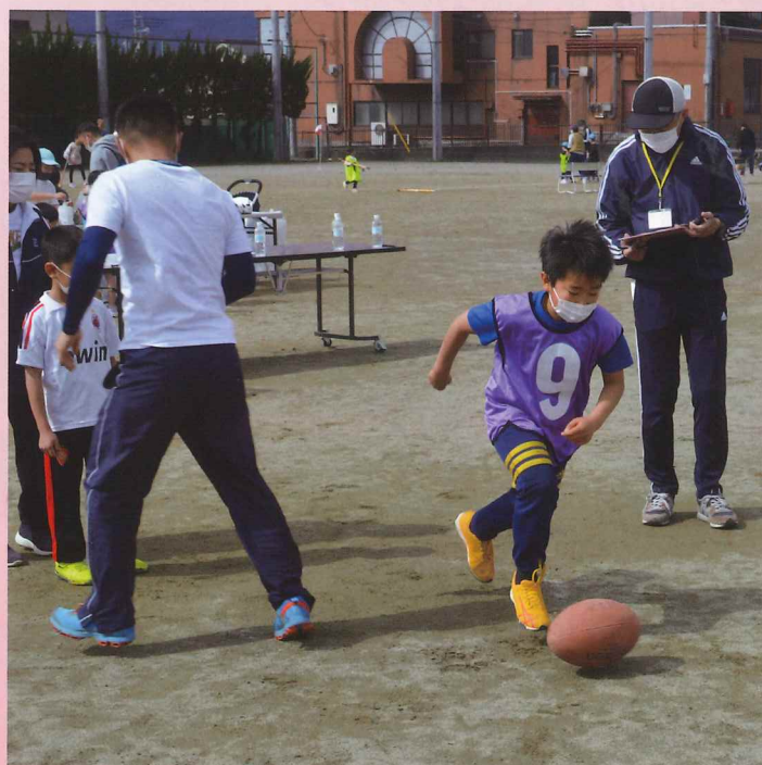
▲ラグビーボール・ドリブル