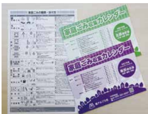
分別方法が分かるゴミカレンダー

排出したごみが原因となる火災を未然に防止するためにも、ごみカレンダーなどを参考にして正しいごみの分別を行うとともに、安全なごみ収集へのご協力をよろしく願います。ごみカレンダーは環境課または各窓口サービスセンターで配布しています。