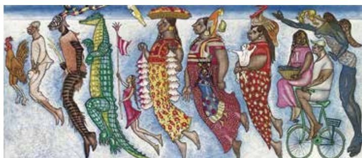
竹田鎮三郎《オアハカ家族》