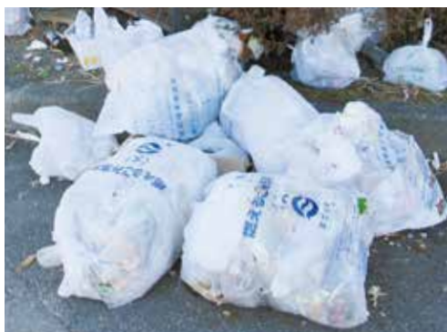
散乱した可燃ごみ

また、家庭から出る可燃ごみの中には多くの生ごみが含まれています。生ごみは多くの水分を含んでおり、燃えにくいいため焼却処分の際には大