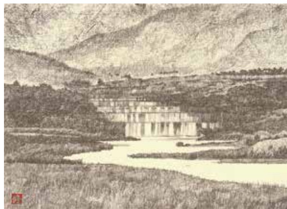
野田修一郎《御勅使川》

会期中はさまざまなイベントを開催します。詳細は美術館ホームページをご覧ください。