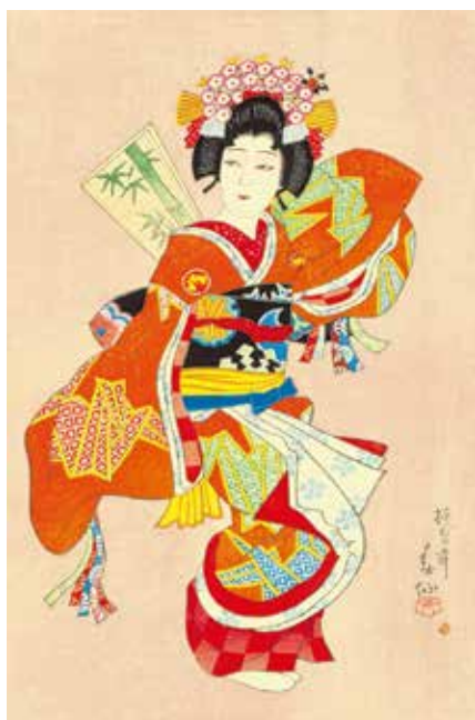
名取春仙《四代目中村富十郎 羽子のかむろ》