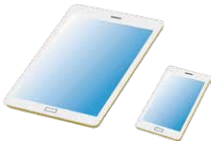
スマートフォン タブレット