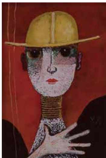
深沢幸雄《黒い瞳の子》