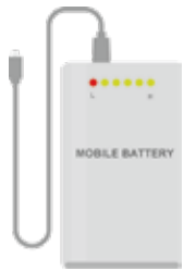
モバイルバッテリー