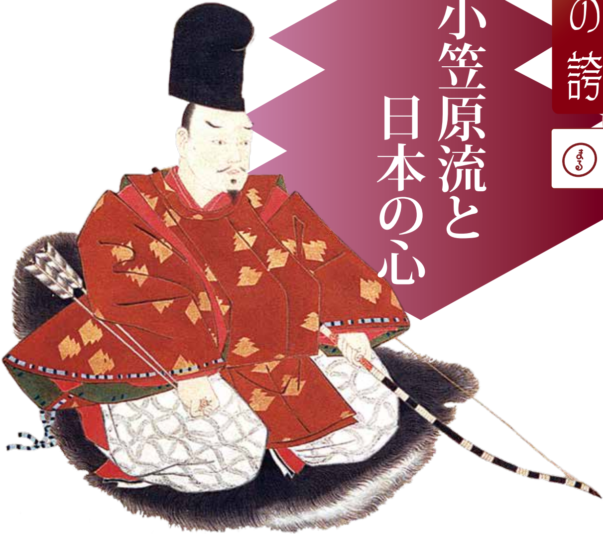
勝山藩主家に伝わる小笠原長清の坐像(福井県開善寺蔵「加賀美遠光・小笠原長清父子坐像」より)。