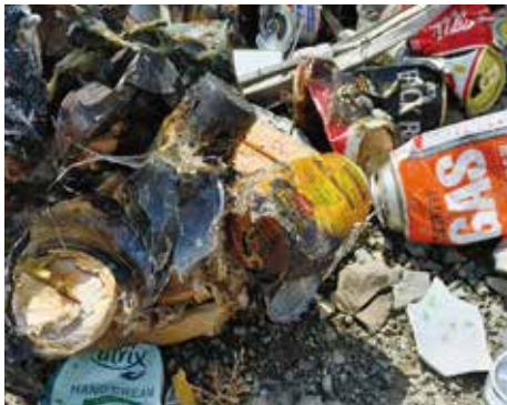
実際に燃えた不燃ごみ

火災の原因は、不燃ごみに混入したカセットボンベもしくはスプレー缶が、収集車のなかで押しつぶされた際に漏れたガスに火花が飛び、他のごみに燃え移ったと思われます。幸いにも収集員が早期に気がつき、ごみ収集業者の敷地内に車両を移動後、収集した不燃ごみを収集車からすべて取り除き消火作業を行ったため、車両にも大きな損害が出ることは免れました。