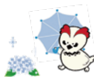
図書館のマスコット キャラクター「ライライ」

甲西図書館 6月 6日(火)～ 9日(金) わかくさ図書館 6月13日(火)～16日(金) 中央図書館 6月21日(水)～29日(木) 市民の皆さまにはご迷惑をおかけしますが、ご理解とご協力をお願いします。