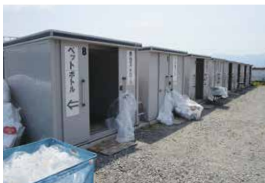
資源回収センター

資源回収センターは、スプレー缶やカセットボンベ、ライターなどのほか、モバイルバッテリー、電子たばこ、スマートフォンなどの充電電池を用いた機器を含む小型家電や各種資源ごみ、粗大ごみをまとめて持ち込むことができる施設です。北部資源回収センター(野牛島)、中部資