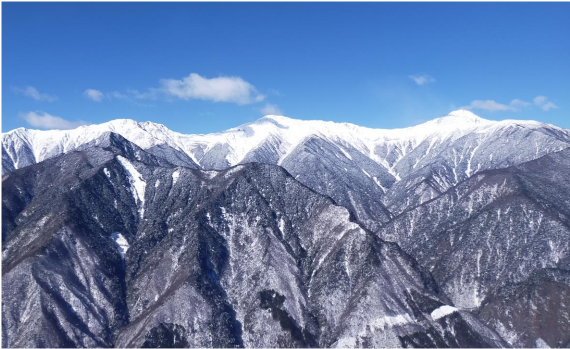
「南アルプス：白峰三山」