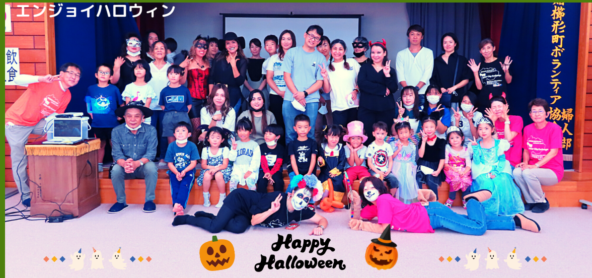
エンジョイハロウィン