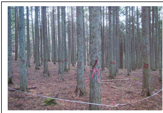
森林整備（間伐）実施前