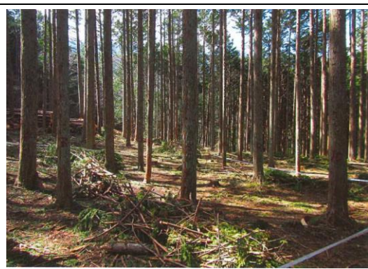
森林整備（間伐）実施後